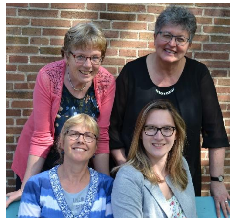
het mantelzorgteam van Manteling

Voor ondersteuning en advies aan mantelzorgers heeft Manteling twee coördinatoren die zijn opgeleid tot mantelzorgmakelaar. Een derde coördinator is in 2019 opgeleid tot casemanager mantelzorg. Een casemanager mantelzorg wordt ingezet bij complexe mantelzorgsituaties, om de samenwerking tussen formele en informele hulp beter te laten verlopen. Daarmee heeft Manteling alle kennis in huis om mantelzorgers vakkundig te kunnen helpen. Met behulp van extra middelen die we in 2019 van de drie Walcherse gemeenten ontvingen, zijn er 33 trajecten door de mantelzorgmakelaars uitgevoerd; 14 in de gemeente Middelburg, 15 in de gemeente Vlissingen en 4 in de gemeente Veere.